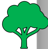
Voortgang scope 2 CO 2